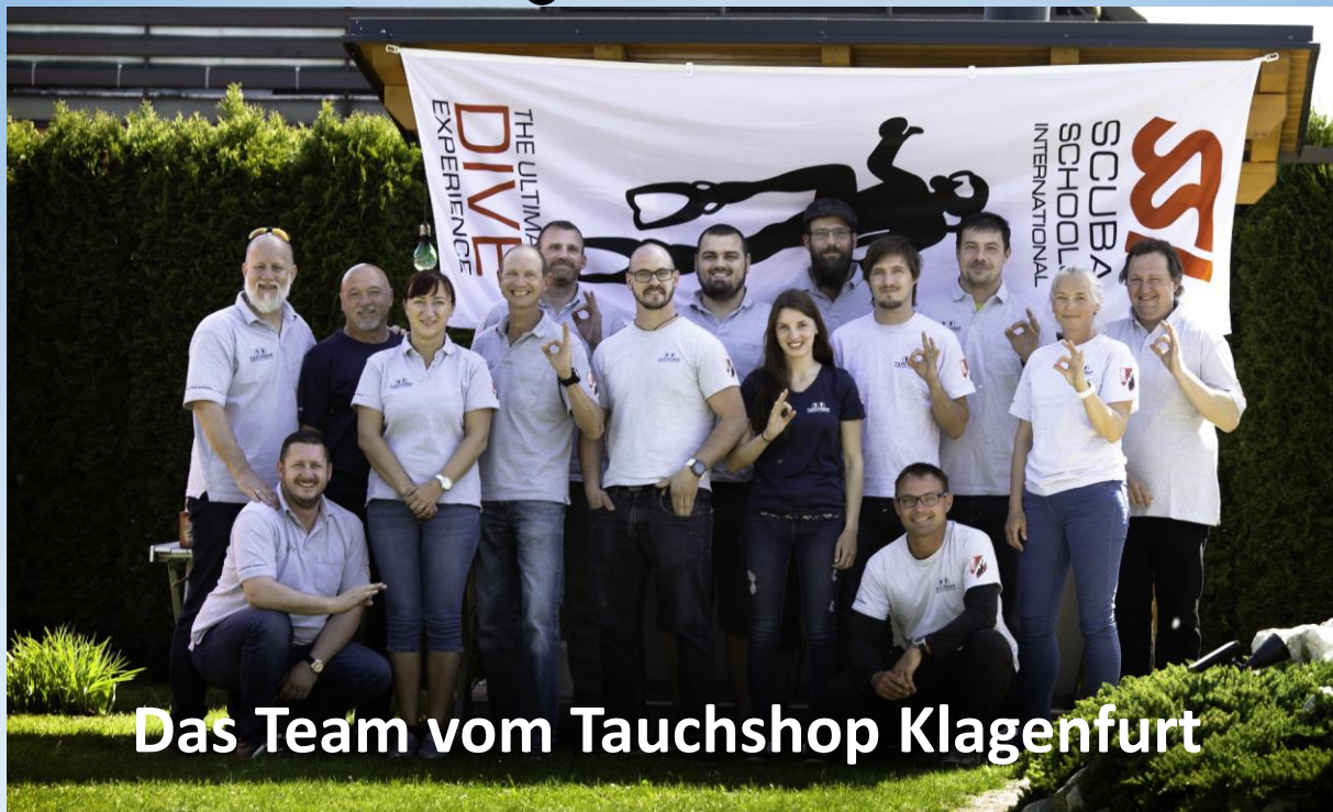
Das Team vom Tauchshop Klagenfurt